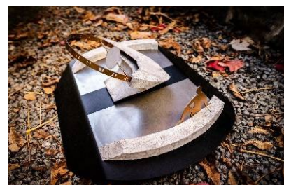
III miejsce (lokalizacja Łódź)