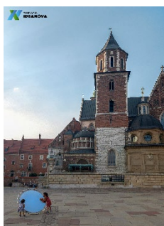
Keloskop na Wawelu