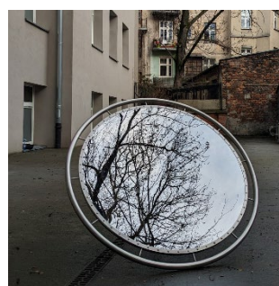
Keloskop w Galerii Podbrzezie

Z początkiem stycznia tego roku, fundacja ogłosiła kolejny konkurs na schronisko turystyczne, mające lokalizację w Beskidzie Wyspowym. To przedsięwzięcie ma już charakter ściśle architektoniczny, ale głównym celem, wymagającym podkreślenia jest wyłonienie projektu, którego wizja będzie nie tylko piękną architekturą, ale wręcz wizją artystyczno-architektoniczną wykraczającą w XXII wiek. Stąd też nie kierujemy tego konkursu wyłącznie do architektów, ale także artystów i designerów. Taka jest misja Fundacji IDEANOVA.