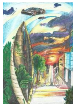
Prace Serca Kapsuły Czasu