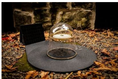
II miejsce (lokalizacja Gorlice)