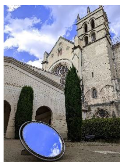
Keloskop w Montpellier