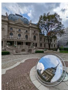
Keloskop w Łodzi

Młodzi architekci i designerzy mogą liczyć na naszą pomoc, jak to było w przypadku instalacji artystycznej pn. „Keloskop”. Rzeźba nie jest efektem procesu konkursowego, ale dzięki naszemu wsparciu, dziś mogą Państwo oglądać ją w przestrzeni publicznej. Po raz pierwszy, rzeźba prezentowana była na zeszłorocznym Festiwalu Żywej Architektury w Montpellier, gdzie autor zdobył główne wyróżnienie. Dotychczas instalację można było oglądać m.in. w Ogrodzie Pałacu Izraela Poznańskiego w Łodzi oraz w Krakowie: na zewnętrznym dziedzińcu Zamku Królewskiego na Wawelu oraz w Galerii Podbrzezie, a od wiosny także w Ogrodzie Botanicznym Uniwersytetu Jagiellońskiego.