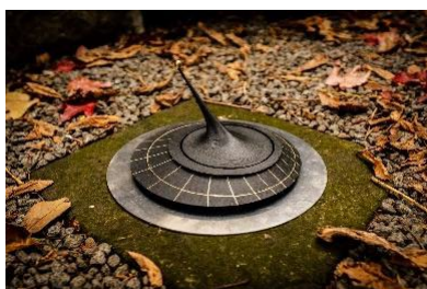
I miejsce (lokalizacja Kraków)

W 2021 roku, Fundacja IDEANOVA rozstrzygnęła międzynarodowy konkurs, którego tematem był 24-godzinny Zegar Słoneczny. Zwycięski projekt jest w fazie realizacji, a jego uroczysta inauguracja odbędzie się 15 września br. u stóp Zamku Królewskiego na Wawelu (ul. Powiśle 11 w Krakowie). W finale znalazły się także dwa projekty, niemal identyczne pod względem wartości artystycznej, ocenione przez szacowne Gremium Jurorskie, dlatego też czynimy odpowiednie starania, które pozwolą nam zrealizować kolejne dwa koncepty.